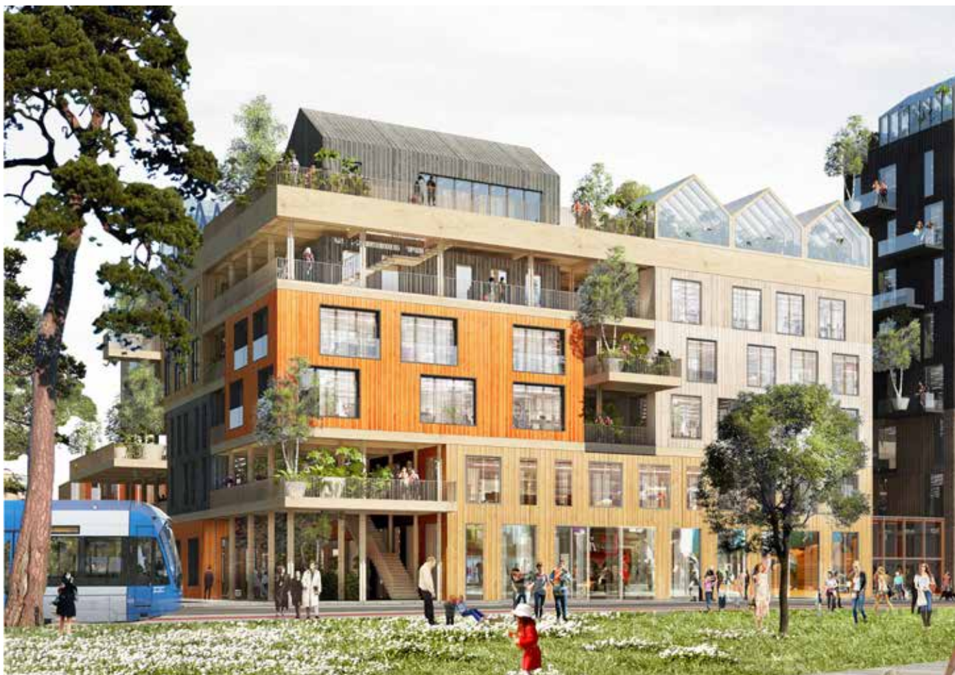
Hållkollbo tillsammans med Slättö. Illustration ADEPT/Mandaworks. 2016.

projektledare och Maria ansvarig arkitekt. De jobbar självfallet tillsammans, men i vissa lägen är det bra om man har olika roller. Ett sådant moment är när man ska delta i alla olika diskussioner då det ska bestämmas vad man önskar för ytor och lägen i byggnaden. Då kan det vara skönt att inte ha alla roller i form av att lyssna in och sätta ner foten, samtidigt som man ska rita på lösningar.