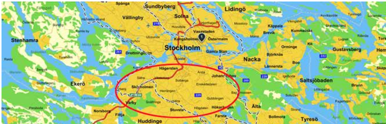
Byggemenskapen Hållkollbos önskemål om plats för markanvisning i Stockholm.

Det har gått 10 år sedan Hållkollbo startades upp och jobbet för att få möjlighet att bygga en ekologiskt, ekonomiskt och socialt hållbar bostadsgemenskap i södra Stockholm började. Turerna har varit många och besöken hos fastighets- och byggbolag och Stockholm stad tidvis frekventa. Försök till samverkan med olika aktörer har ibland varit lovande i en uppstart, men samarbetet har avstannat av olika anledningar. Stockholm stad har inte tryckt på för att få byggemenskaper realiserade. Det är först med projekt Fokus Skärholmen där flera tusen nya bostäder ska byggas, som man går ut med budskapet att byggemenskaper ska få en chans.