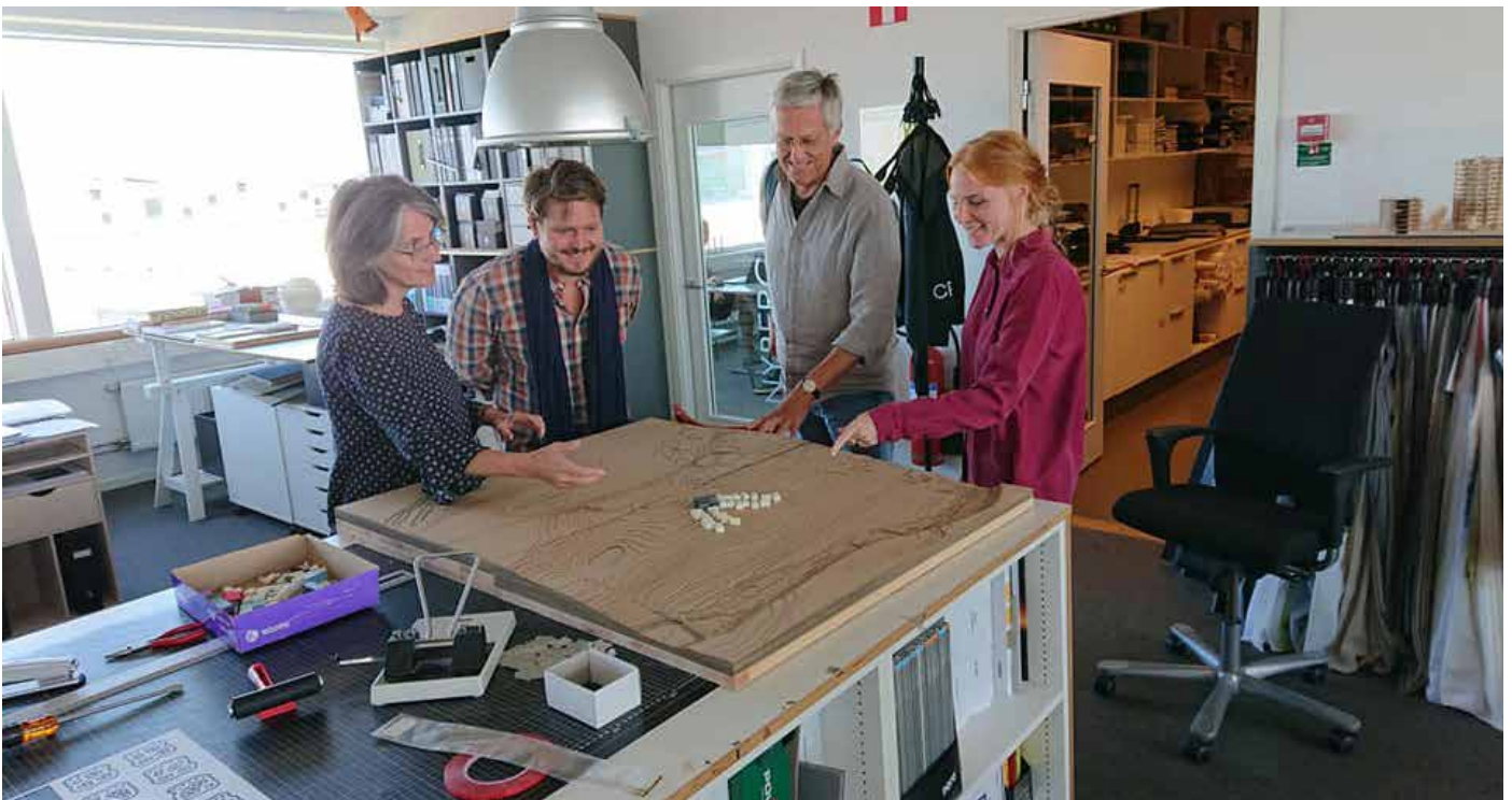
Möte vid modell över landskapet som delvis ska bebyggas. Stora ytor behövs för olika slags odlingar.

Tidigare var man övertygade om att kooperativ hyresrätt var det bästa valet av upplåtelseform för den nya bebyggelsen. Efter dagar i Malmö, med byggemekapsmöten inom DiverCity, har man blivit mer osäkra på om detta är det lämpligaste valet.