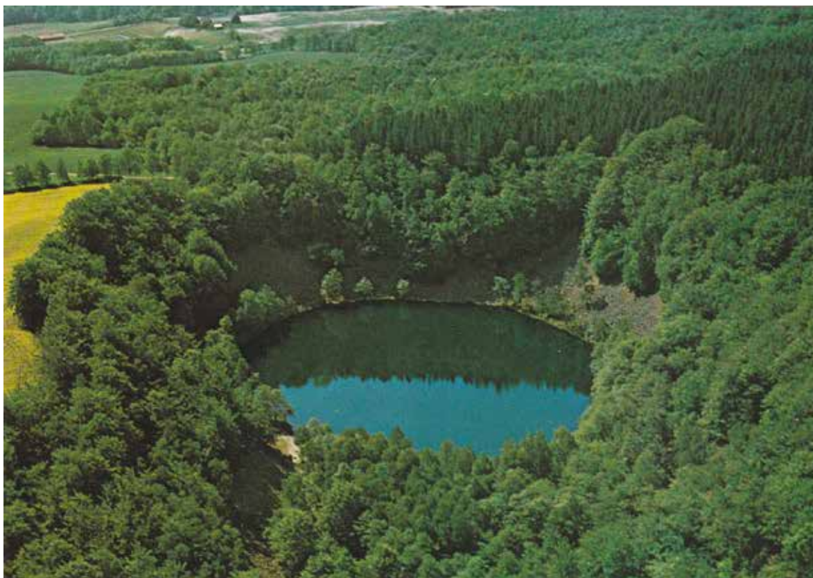
Den sägenomspunna Odensjön. Röstånga-bygdens historia är full av geologiskt intressanta fynd och mytologiska berättelser.

År 2015-2016 tog allt fart på nytt igen och med ny anda. Det fanns en längtan efter att kunna dela på resurser, så som fibernät, energi och avlopp. Två nyinflyttade småbarnsfamiljer som var intresserade av ekobyar gav en energiinjektion. De hade redan pratat med kommunen. De var kunniga och medvetna och ett önskemål var exempelvis att klara energi-försörjningen på egen hand och bli ett så kallat plusenergi-område, liknande vad som har skett på den danska ön Samsø.