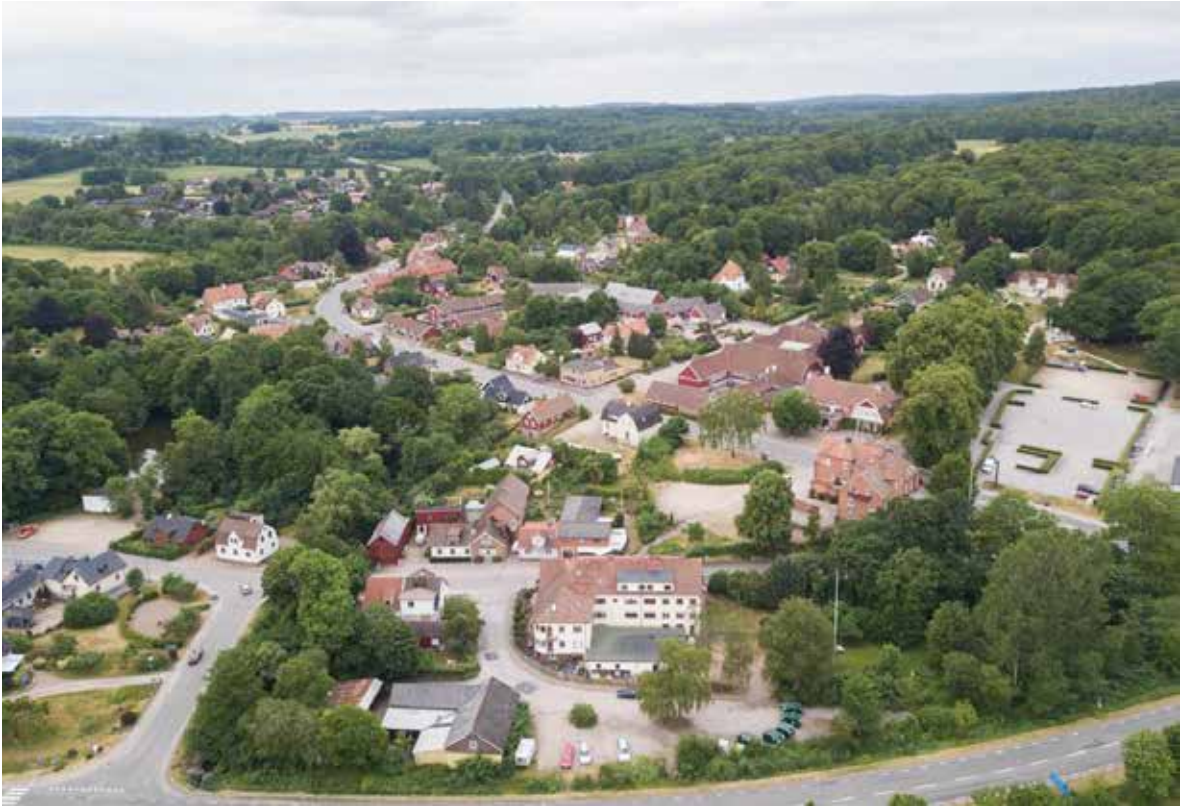
Flygbild över Röstånga.