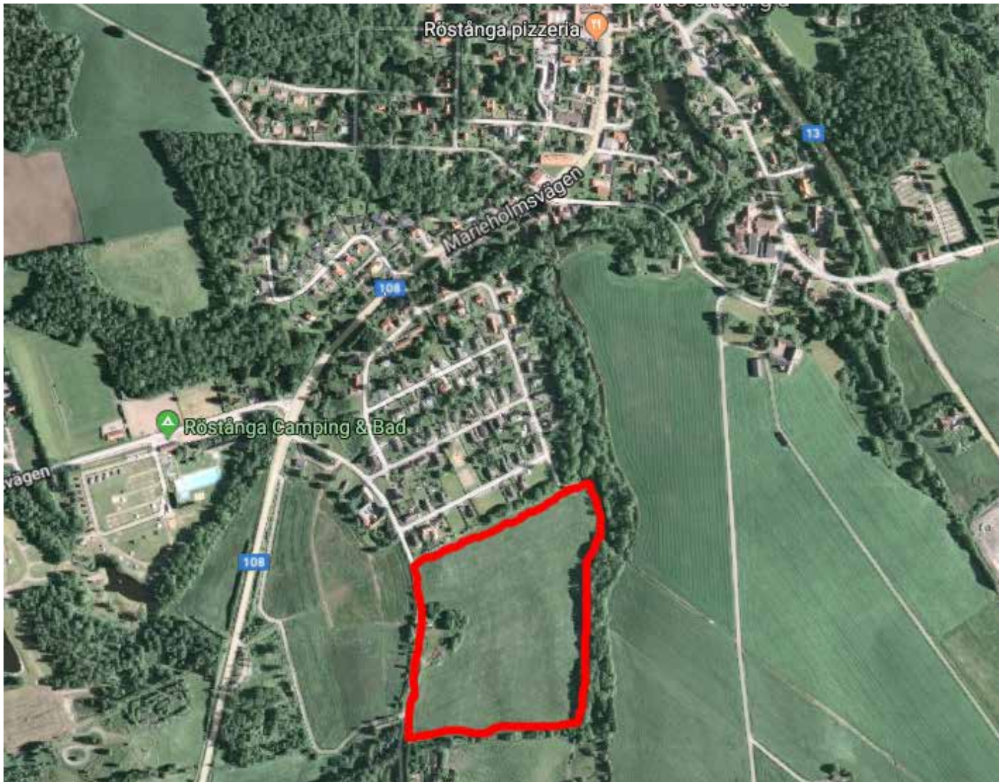
Området söder om byn som är avsatt för Röstånga R:ekoby.